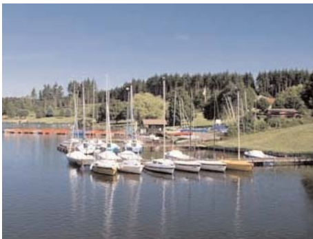
Stausee in früheren Zeiten

Bürger nah will der derzeitige Bürgermeister sein.